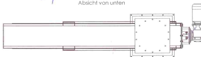
Absicht von unten